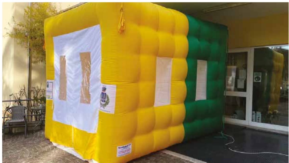
Savignano sul Rubicone, 10 febbraio 2021. Nella foto in alto l'inaugurazione del Tunnel degli Abbracci realizzato grazie al sostegno di RomagnaBanca presso la Casa Residenza di Savignano sul Rubicone per la cooperativa sociale L'Aquilone. Di seguito un'immagine del primo abbraccio che ha inaugurato il Tunnel e sotto la struttura gonfiabile

Sulla base di queste fondamentali e irrinunciabili esigenze, RomagnaBanca Credito Cooperativo ha sostenuto, assieme al comune di Savignano sul Rubicone, la richiesta della Cooperativa Sociale “L'Aquilone”, socia di RomagnaBanca, operativa con le Case di Residenza Anziani, a Riccione, Santarcangelo di Romagna, San Mauro Pascoli, Savignano sul Rubicone, Cesena, per l'acquisto del “Tunnel degli Abbracci” da installare all'ingresso della Casa Residenza Anziani di Savignano sul Rubicone. La “stanza” è una struttura gonfiabile realizzata in nylon, riscaldata, suddivisa in due ambienti separati da un materiale trasparente che prevede la possibilità di potersi abbracciare attraverso maniche morbide appositamente studiate. Possiamo certamente sostenere che non sarà la soluzione risolutiva per il ritorno alla normalità delle relazioni, ma sicuramente avrà il merito di contribuire a regalare qualche attimo di gioia in più. Un caloroso abbraccio! Questa volta è il caso di dirlo.